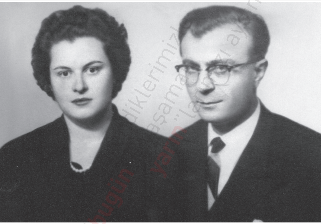
Sâtiâ Hanım Sultan ve Osman Turan