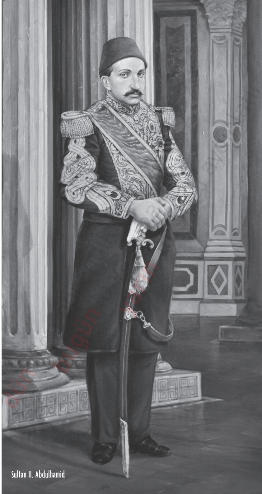
Sultan II. Abdülhamid