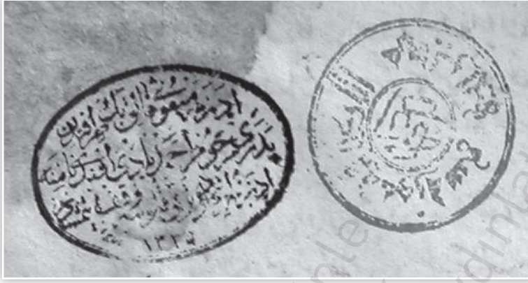
Resim- Eserde yer alan mühürler.