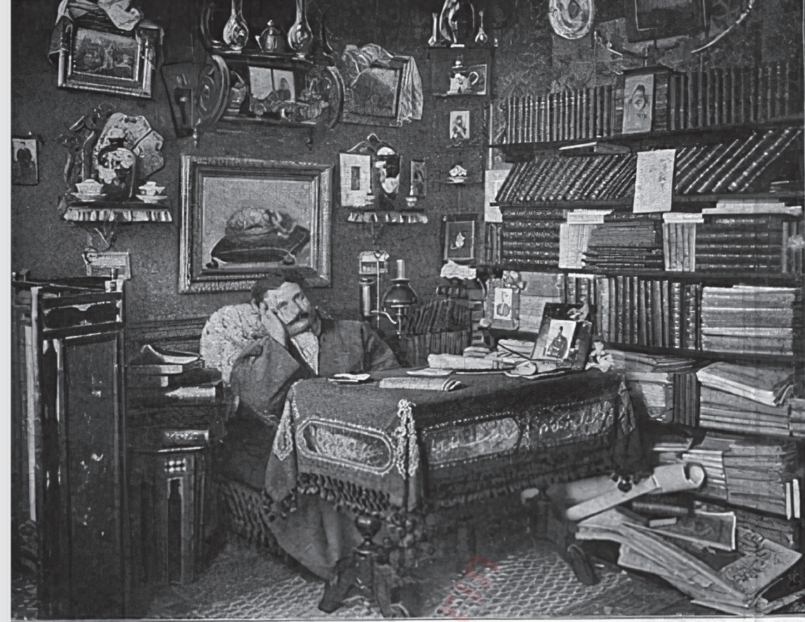
« رباب شکسته » مناسبتیه : توفیق فکرت بک، کوشه اشتغالده . Tevfik Fikret Bey, auteur du Rëbabî-Chikestë, dans son cabinet de travail.

Rübâb-ı Şikeste münâsebetiyle: Tefvik Fikret Bey, gûşe-i iştigâlinde. Servet-i Fünûn . 465 (27 Kânûn-ı Sâni 1315 / 8 Şubat 1900): 357.