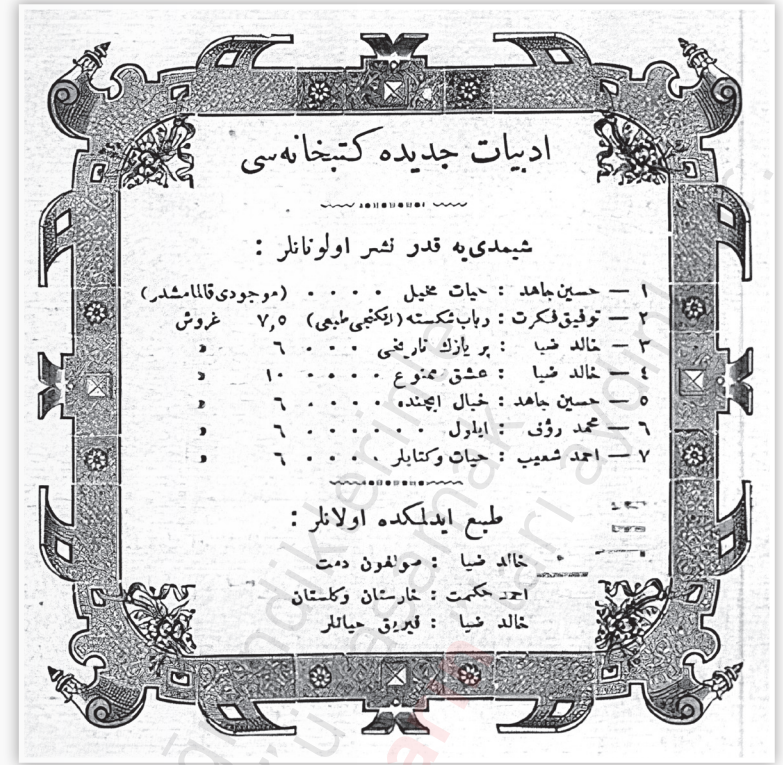
Servet-i Fünûn . 536 (7 Haziran 1317 / 20 Haziran 1901): 243.

Rübâb-ı Şikeste toplam dört baskı yapmıştı. Üçüncü baskısı, ilk baskısından on yıl sonra 1910 yılında yapıldı. Onu bir yıl sonra dördüncü baskı (1911) takip etti. Rübâb-ı Şikeste 'nin dört baskısına bütüncül olarak bakıldığında ilk iki baskı ile son iki baskı arasındaki farklılıklar (sayfa sayıları ve numaraları, içerdikleri şiirler, baskı kaliteleri) hemen kendini belli eder. Rübâb-ı Şikeste 'nin ilk iki baskısı 363 sayfa iken üçüncü baskısı 411 ve dördüncü baskı 427 sayfadır. Son iki baskıda en önemli değişikliklerden biri hiç şüphesiz Fikret'in 1900-1908 yılları arasında yazdığı dilden dile dolaşan şiirlerinin Rübâb-ı Şikeste 'ye girmesiydi. Öte yandan Fikret'in üçüncü baskıda vasf-ı terkîbî yapıları için iki kelimenin