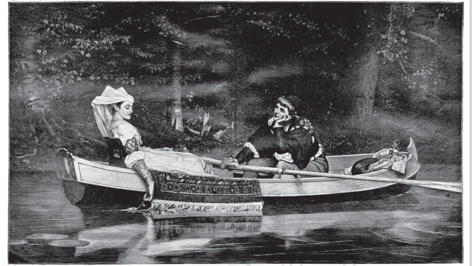
[ Şah Nefise'nin Tablosu ] روح حیات بوک فو، حیات ؛ چنگه صافق آمال و صامت ، زودبه .. اورنشال کواره سودا ، بر لانا جنوال . کول ساهت تکده ناینگه جنت ؛ ساری پویشل گولنگه برتوش آتک پتی ؛ ساحلریل، انتارییل، سانکلیت وریک دیلمش موقه شان پریش برتک پتی . برسام توه : انتجار بیله مست هودور ، بر حسه آلیر شوایق روح رفیک شوق و شغلند ؛ بر د . ص . سودا .. بونه خالدر الی نه صفادور .. بر نظره حیران ایله بر چیره ساقی قارشیده طورونکی .

Fikret'in Servet-i Fünûn 'da yayımlanan ilk şiiri ("Sanâyi'-i Nefise'den Tablo: Hayrân" başlıklı tablonun altında). M. T. Fikret. Servet-i Fünûn . 254 (11 Kânûn-ı Sâni 1311 / 23 Ocak 1896): 312-313. Söz konusu şiir, Rübâb-ı Şikeste 'de "Bir Levha İçin" başlığıyla yer almaktadır.