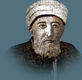
VAK'ANÜVİS AHMED LUTFİ (1817-1907)

Son dönem Osmanlı vak'anüvîslerinden olan Ahmed Lutfî Efendi, İstanbul'da dünyaya gelmiştir. Mahalle mektebinde okuduktan sonra Mühendishâne-i Berrî-i Hümayûn'a gitmek istemişse de kendisinde askerliğe istidat görmediğinden bir sene sonra mektepten ayrılmıştır. Amcazâde Hüseyin Paşa Medresesi'ne giren Ahmed Lutfî böylece ilmiye mesleğine intisap etmiş ve 1831'e kadar orada sekiz sene Arapça, Farsça, tefsir, fıkıh, hadîs gibi ilimler tahsil etmiştir. 1845 senesinde İmar Meclisi seyyar kâtibî olarak Vidin ve Niş'te memurluklarda bulunmuş, 1848 senesinde vergi tahsilî için geçici görevle Filibe'ye gönderilmiştir. 1852-1865 yılları arasında Takvimhâne musahhihliği, Tıbbiye Meclisi Azalığı, Tıbbiye Mektebi Türkçe hocalığı ve Matbuat Nazırlığı'nda görev almıştır. On ay sonra nezaretin ilgisiyle emekliliğe ayrılan Lutfî Efendi, iki ay sonra ikinci kez Maârif Meclisi Azalığı'na, 1865 senesinin sonlarında ise Ahmed Cevdet Paşa'nın yerine "vak'anüvislik"e tayin olunmuştur. Ahmed Lutfî, Osmanlı vak'anüvîsleri arasında bu görevde en çok kalan kişidir. Bir süre sonra İstanbul Kadısı pâyeliği ve Şûrâ-yı Devlet azalığı verilmiş; 1879'da Anadolu, 1881'de ise Rumeli Kazaskerliği'ne tayin olunmuştur. 18 Mart 1907'de doksan üç yaşında iken Boyacı Köyü'ndeki yalısında vefat eden Ahmed Lutfî Aksaray civarında Sofular Camii hazinesine defnedilmiştir.