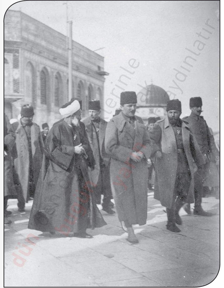
Enver Paşa ve Cemal Paşa, Kudüs'te Mescid-i Aksa'yı ziyaret ederken