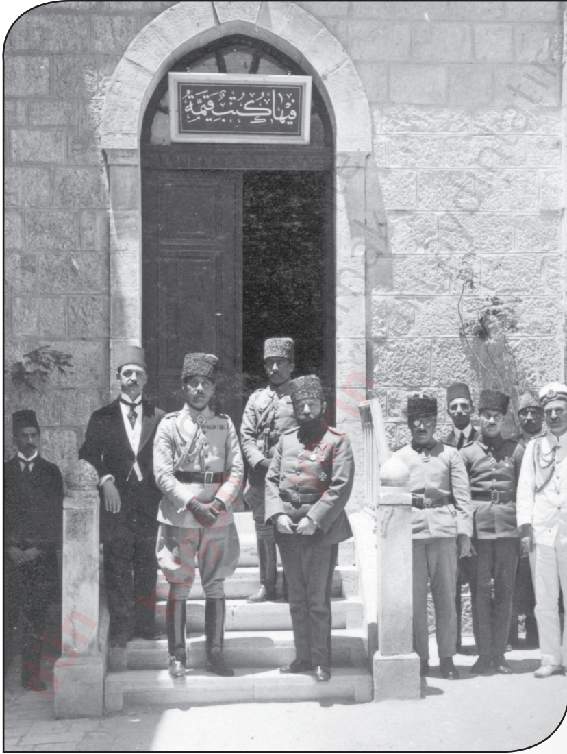
Şehzâde Osman Fuad Efendi, Cemal Paşa ile Kudüs'te yeni açılan Salâhiye Okulu önünde, 1917