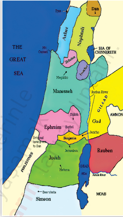
Harita 1: On iki Kabile ve Yerleşim Yerleri (Jewish History, 2023)

İsrailoęullarının Tanrı'nın vaadi olan Kenan yurduna dönüş süreci, Perslerin Babillileri mağlup etmesiyle başlamıştır. Persler, Yahudileri Ezra'nın liderliğinde vaat edilen topraklarda yer alan Galile, eski Ürdün ve kıyı şeridinde yerleşmeye teşvik etmiş ve Süleyman Mabedi'ni onarmalarını sağlamıştır. Bu sayede İsrailoęulları, Tanrı'nın vaadi olan topraklarda tekrar örgütlenmişlerdir.