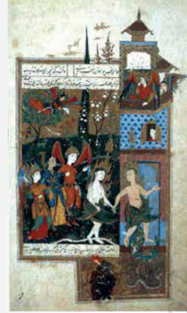
Resim 6. Fuzûlî, Hadikatü's-Süedâ , vr.9a