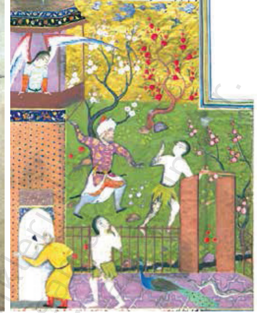
Resim 7. Nişâbüri, Kısâs-ı Enbiyâ , vr.13b