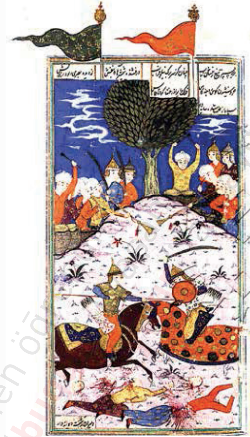
Resim 20. İskender'in savaşları, Emir Hüseyin Dihlevî, İskendername, vr. 189b.