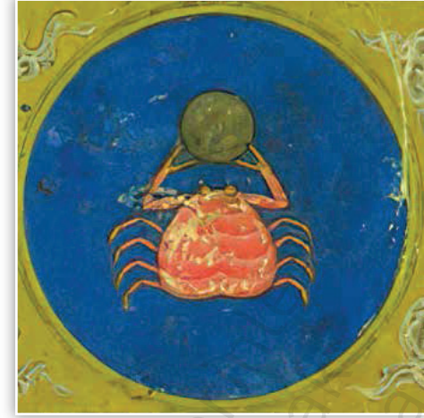
Resim 37. Mecmû'a-i Eş'âr, vr.159b

Metâli 'ü's-Sa'âde 'de Seretân burcunun minyatüründe daire içerisinde ay figürünü taşıyan yengeç tasvir edilmiştir. Seretân burcunun yıldızının Kamer olması sebebiyle burcun minyatüründe ay görseleline yer verilmiştir. Yengeç gerçekçi bir üslupla bordo olarak resmedilmiştir. Ay, insan yüzü şeklinde tasvir edilmiştir.