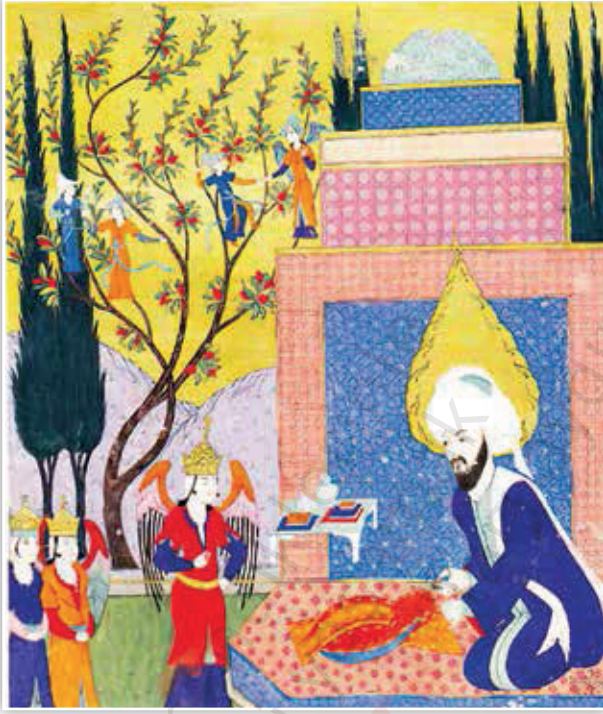
Resim 12. Seyyid Lokmân, Zübde'tü't-Tevârih , (And, 2008: 200).

Nâbi, Hz. İdrîs'in meleklerle öğretmenlik etmesine telmihte bulunmuştur. Minyatürlerde de Hz. İdrîs'in öğretici vasfı öne çıkmaktadır.