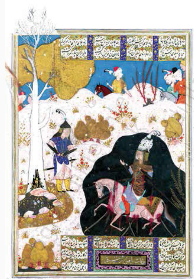
Resim 43. Rüstem'in ölümü, Firdevsî, Şehnâme , TİEM 1984, 365a 81