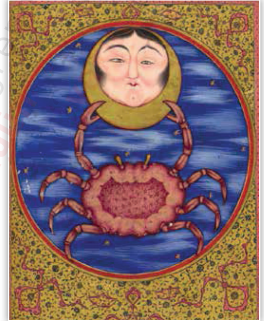
Resim 38. Su'ûdi, Metâli 'ü's-Sa'âde, vr. 14b

Metâli 'ü's-Sa'âde 'de Seretân burcunun minyatüründe daire içerisinde ay figürünü taşıyan yengeç tasvir edilmiştir. Seretân burcunun yıldızının Kamer olması sebebiyle burcun minyatüründe ay görseleline yer verilmiştir. Yengeç gerçekçi bir üslupla bordo olarak resmedilmiştir. Ay, insan yüzü şeklinde tasvir edilmiştir.