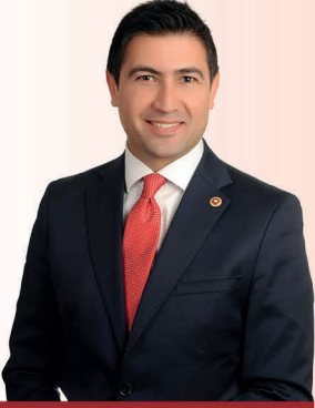
Av. Cahit ÖZKAN

Denizli/Çivril'de doğdu. 1999 yılında İstanbul Hukuk Fakültesinden mezun oldu. Lonra'da İngilizce öğrendi, Kocaeli Üniversitesinde master yaptı. Serbest avukatlık mesleğini icra ederken, (STK, Medya, Eğitim) birçok sosyal aktivitede bulundu. 26. Dönem Denizli milletvekili olarak görev yapmaktadır. İngilizce ve Arapça bilmekte, evli ve 3 çocuk babasıdır.