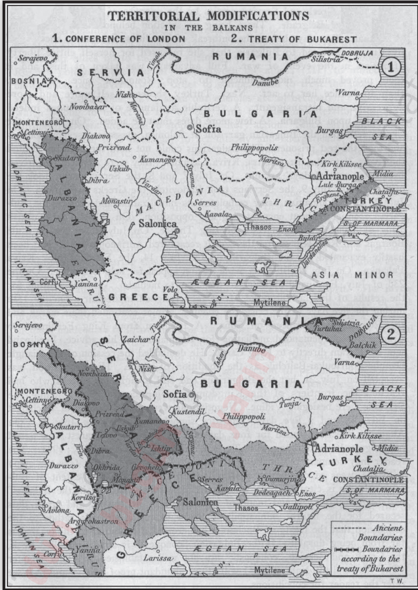
Balkan Devletleri'nin savaş sonundaki yüzölçümleri 27