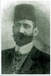
MÜŞİR HÜSEYİN KIDWAI (1878-1937)

Hindistan Müslümanlarının önemli şahsiyetlerinden biri olan Kıdwai avukat, siyasetçi, yazar, delege, hatip gibi çok yönlü kimliğiyle tanınmaktadır. İngiltere'de hukuk okumuştur. Hint Hilâfet hareketinin öncülerindedir. Osmanlı aşkı ve sevgisiyle dolu birisidir. Avrupa'daki diplomatik ve siyasi faaliyetlerinde Osmanlı Hilâfeti'ni Batılı devletlere, özellikle de İngiltere'ye karşı savunmuş ve Osmanlı'yı İngiltere'ye yaklaştırmaya çalışmıştır. Mutlakiyet (1906) ve Meşrutiyet (1910) devirlerinde İstanbul'a gelerek Osmanlı idarecileriyle temaslarda bulunmuştur. Osmanlı basını onu "büyük İstâm âtimi ve mücahidi" olarak kamuoyuna duyurmuştur. Kıdwai, tarih sahnesinden çekilene kadar hep Osmanlı'nın yanında olmuş, Osmanlı'ya dost kalmıştır.