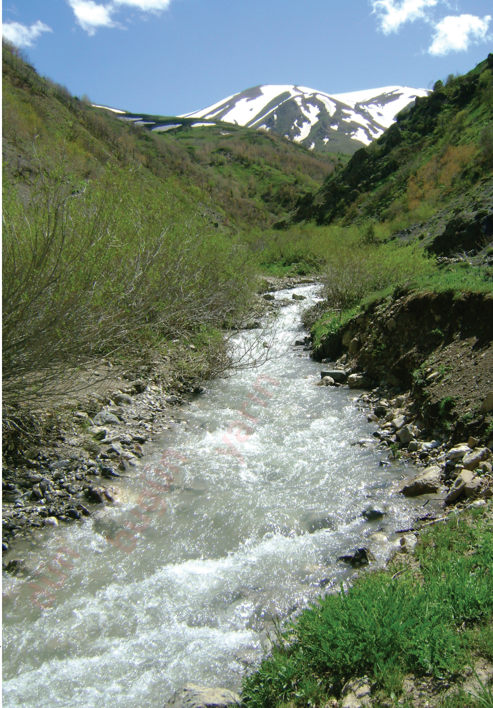
“Kanlıca’dan bir görünüş”