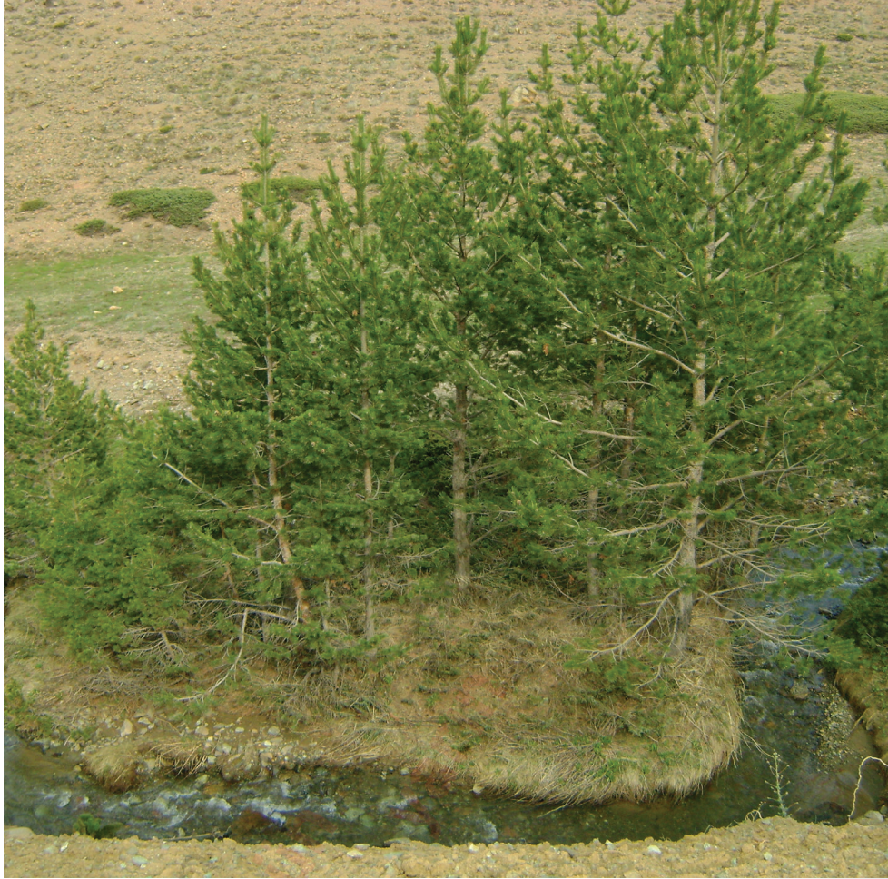
“Çamlıktan bir görünüş”

Kop köyünün ilk mahallesi olan Yukarı Kop'tan girişte, sağ tarafta 1950'li yıllarda yapılmış, yıllara meydan okurcasına duran ilkokul binası bulunur. Biraz ileride, sol tarafta Nezim Dayı'nın değirmeni vardır. Değirmenin durumu da ilkokul binasından farklı değildir. Kullanılmamasına rağmen bir asırdır ayakta kalmayı başaran değirmen, günümüzde de bu çabasını sürdürmektedir.