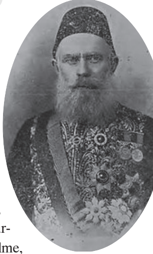
Ahmet Cevdet Paşa (1823-1895)

Osmanlıların Batılı devletlerin hücum ve saldırılarına maruz kalmalarının en başta gelen sebeplerinden bir tanesi Batılı çevrelerce "lâyıkıyla bilinip değerlendirilmemeleri" gerçeğidir. Aşağıda Osmanlı