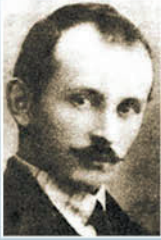
Ömer Seyfettin (1884-1920)

11 Mart 1884 günü Balıkesir'in Gönen ilçesinde doğdu.