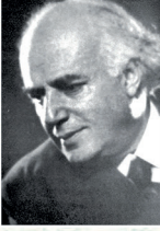
BURHANETTİN TEPŞİ (1882–1947)

Yurtdışında tiyatro eğitimi alan ilk Türk aktörler arasındadır. İstanbul'un Fatih semtinde dünyaya gelmiştir. Roman, tercüme ve tiyatro eserleri bulunan Yusuf Neyyir'in üçüncü çocuğudur. Üsküdar'daki Valide Camii'nde mahalle mektebinde okur. Envâr-ı Maarif, Ravza-i Terakki Mektebi ve Mekteb-i Sultânî'de eğitim hayatını sürdürür. Sadâret-i Uzmâ Dairesi'nde tercüman yardımcısı olarak görev yaparken, 1906 yılında Fransa'ya gidip iki yıl konservatuar eğitimi alır. Comédie Française sanatkârlarından Eugéne Silvain ile Segond-Weber'in özel tiyatro derslerine katılır. II. Meşrutiyet'in ilanından sonra İstanbul'a dönüp kurduğu tiyatro kumpanyası ve çeşitli tiyatro topluluklarıyla sahne hayatındadır. Dârülbedayî-i Osmanî'nin ilk öğretmenleri arasında yer alır. I. Dünya Savaşı'ndan sonra pek çok ülkeye turneler düzenler. Cumhuriyet'in ilk yıllarından 1940'a kadar tiyatro faaliyetlerini Fransa'da yürüten Burhanettin Tepsî, yurda döndüğünde Burhanettin-Seniye Tepsî Tiyatrosu'yla İstanbul semtlerinde, Anadolu şehir ve kasabalarında eşile birlikte sahnededir.